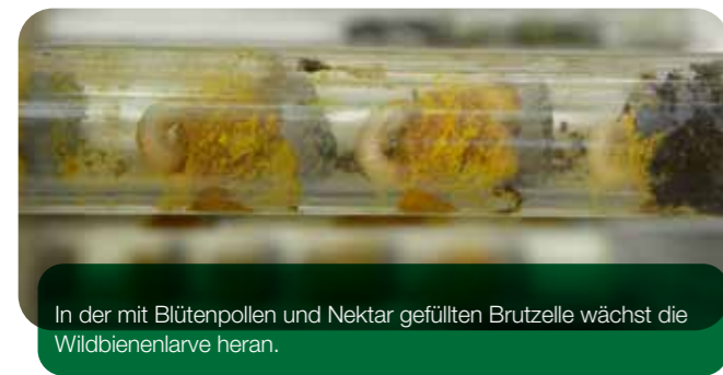
In der mit Blütenpollen und Nektar gefüllten Brutzelle wächst die Wildbienenlarve heran.

In den Niströhren legen die Weibchen jede für sich ab Ende März ihre Eier ab.