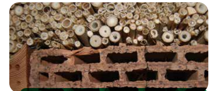
So nicht! Hohlblockziegel werden nicht besiedelt.