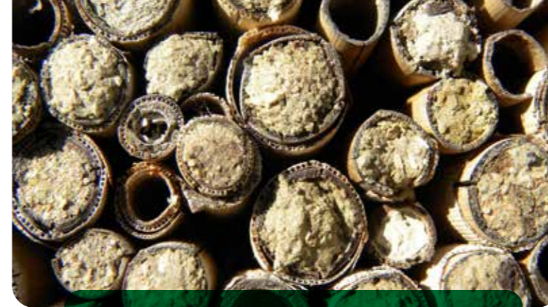
Sauber geschnittene Schilfhalme werden gerne besiedelt, was an den verschlossenen Öffnungen erkennbar ist.