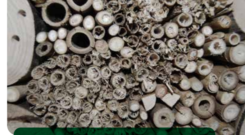
So nicht! Unsauber geschnittene Halme werden ebenso wenig besiedelt wie gefüllte Stängel.