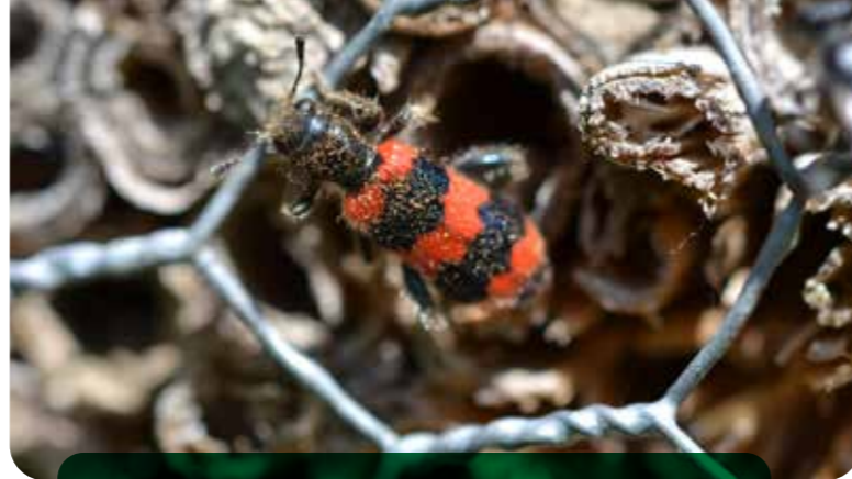
Der Immenkäfer ist ein Nestparasit, der den Bruterfolg der Wildbienen reduzieren kann.