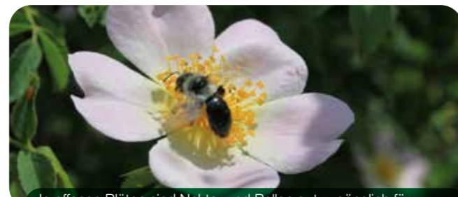
In offenen Blüten sind Nektar und Pollen gut zugänglich für Wildbienen und andere Insekten.

Ein vom Frühjahr bis zum Herbst vielfältig blühender Garten versorgt die Bewohner des Nützlingshotels mit Nahrung. Besonders geeignet sind Korbblütler, Schmetterlingsblütler, Kreuzblütler, Lippenblütler, Weiden und Obstbäume.