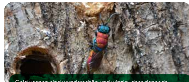
Goldwespen sind wunderschön und winzig, aber dennoch gefräßige Räuber am Wildbienenhotel.

Kuckucksbienen, Goldwespen, Schlupfwespen oder Taufiegen treten als Nestparasiten auf. Ihre Brut ernährt sich von den Wildbienenlarven. Spechte, Meisen und andere Vögel haben ebenfalls das Nützlingshotel als Futterplatz entdeckt. Sie picken die Hölzer auf und ziehen die besiedelten Stängel heraus, um die Bienenlarven zu fressen. Ein Vogelschutzgitter kann die Larven schützen, aber auch die Fraßfeinde haben ein Recht zu leben, zumal sie häufig ebenfalls selten sind.