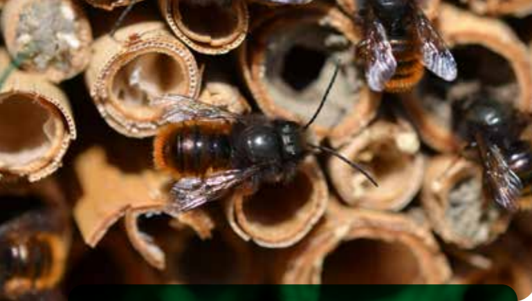
Wild lebende Verwandte der Honigbiene: Mauerbienen zählen zu den häufigsten Bewohnern des Nützlingshotels.