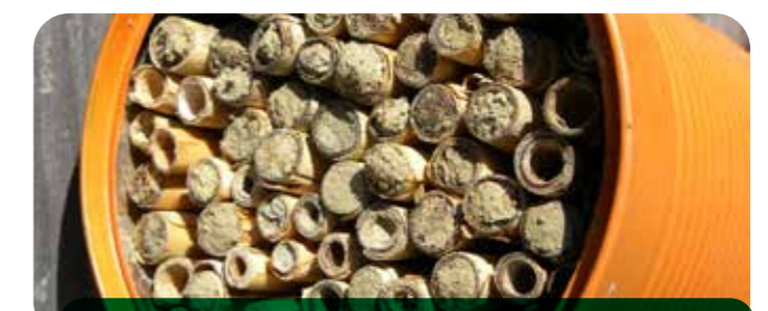
Das Dosenhotel bietet Platz für mehrere Hundert Wildbienen, die sich hier entwickeln können.